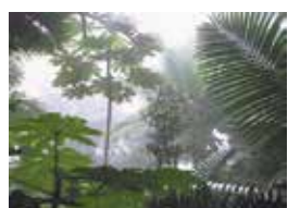
Nhiệt đới hóa

Các bộ ngắt bảo vệ và bảo vệ dòng rò bằng điện tử tuân theo tiêu chuẩn tương thích điện từ IEC 60947-2, phụ lục B và F