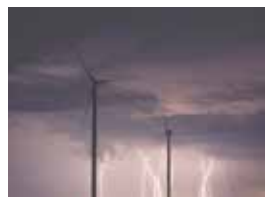
Tương thích điện từ